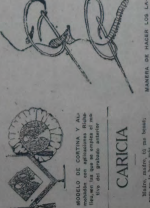
MANERA DE HACER LOS LABORES Y el perfil de la labor