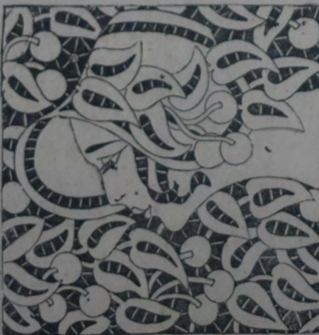
APLICACION DE RICHELIEU, UTI LIZABLE PARA VARIAS LABORES. Es de ejecución fácil y da magníficos resultados.